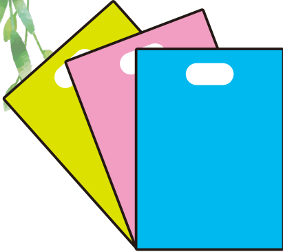
ファッションバッグ