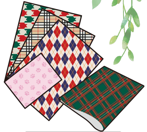
カルペーパー など