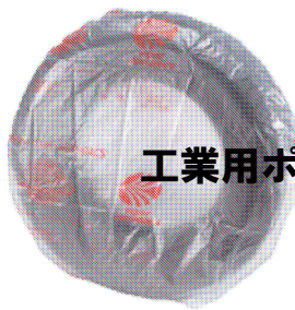
工業用ポリエチレン