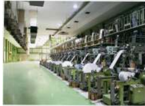
N-スーパーパワーバッグの製造ライン(徳島)

・長年の実績による“ 最適の原料配合 ” → 耐衝撃強度のHDPE原料を採用。 ポリエチレン100%。(強化剤などは使用せず)