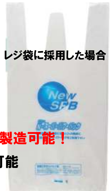
レジ袋に採用した場合